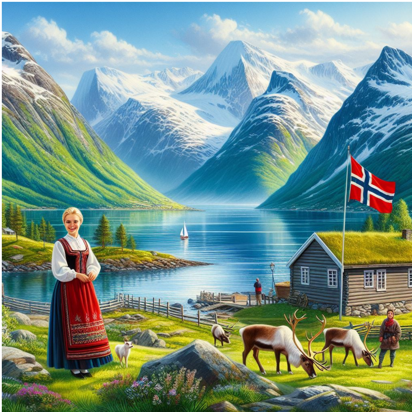
Norge og det norske ifølge KI.