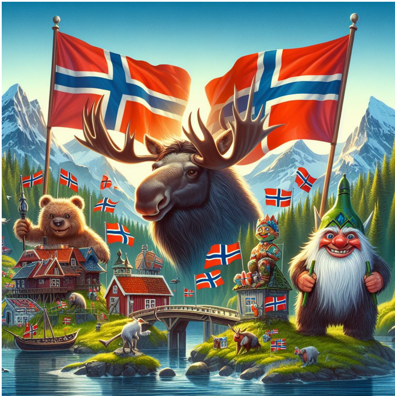
Dette er Norge ifølge KI. Generert av: Microsoft Copilot i Bing - Designer (Formgivning).