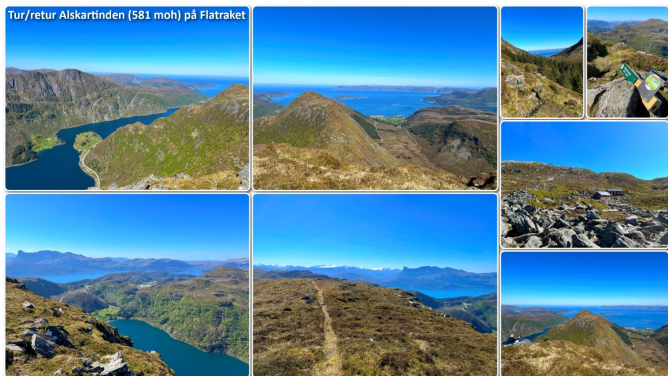
En kollasj med bilder fra fjellturen 18.05.2025 opp til og ned fra Alskartinden (581 moh).