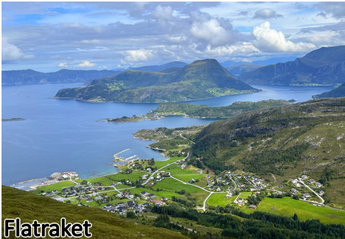
Bilde av bygda Flatraket tatt fra utkanten av Gangeskaregga / Nakkjen, sommeren 2024.