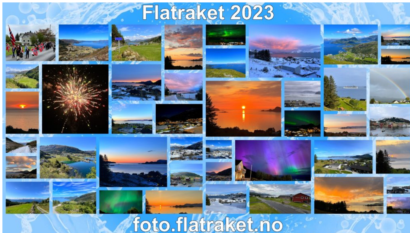
Kollasj bestående av bilder fotografert år 2023, Flatraket.