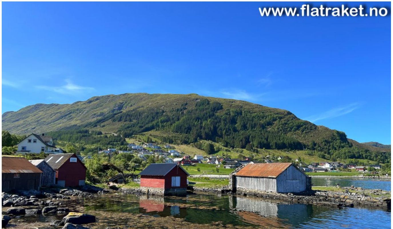
Bilde fotografert i nærheten av Keila (og småbåthavna) på Flatraket, 20. mai 2024.

Sannsynligvis har KI-en nyttiggjort seg av informasjon fra Wikipedia , i tillegg til informasjonen fra min egen Flatraket-presentasjon .