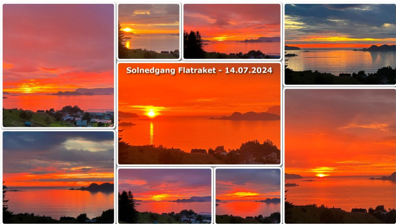
Solnedgang på Flatraket 14.07.2024.