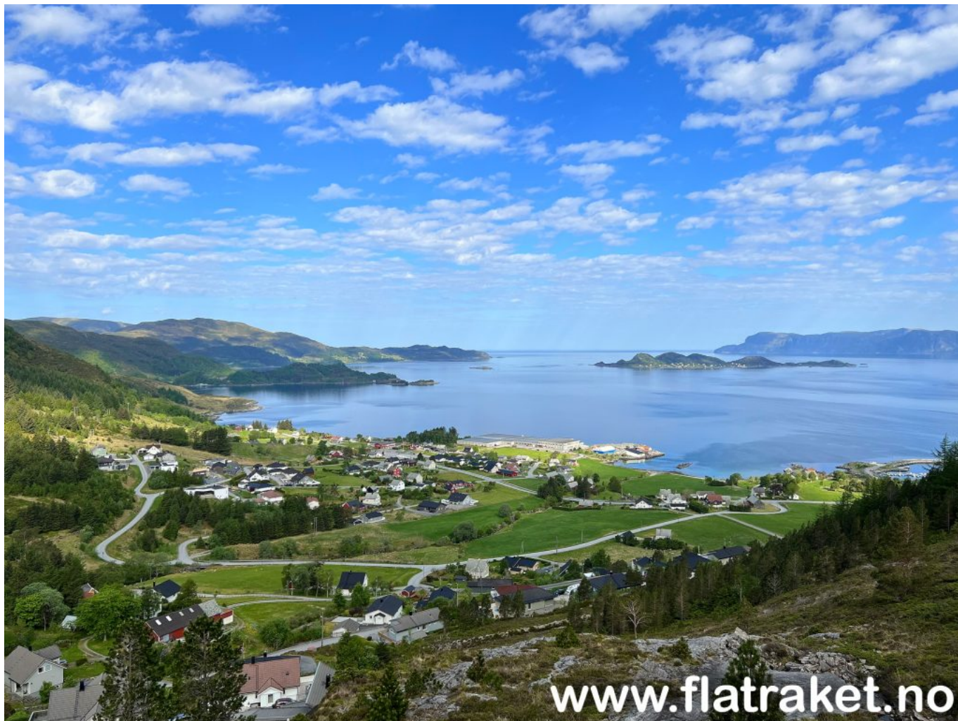
Foto fra en liten fjelltur på Flatraket oppover mot «Grautafatet», 17. mai 2024.