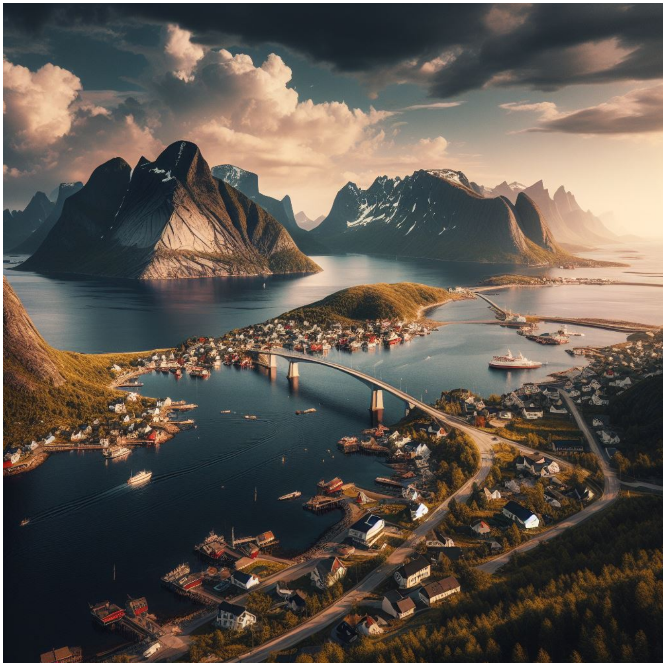
Dette er Måløy ifølge KI. Designet av: Microsoft Copilot i Bing - Designer (Formgivning).