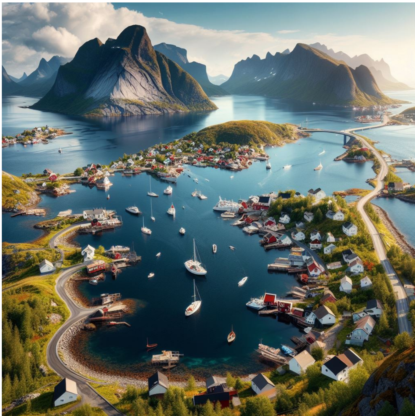
Dette er kystbygda Flatramn ifølge KI. Designet av: Microsoft Copilot i Bing - Designer (Formgivning).